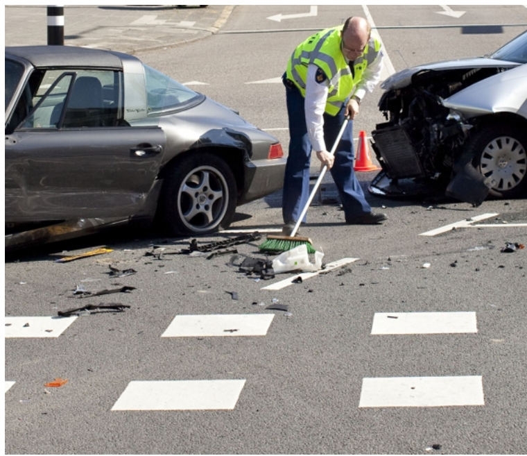
Als een klant veel schadegevallen veroorzaakt, mag de verzekeraar de premie verhogen.

Hierover zegt de ombudsvrouw dat veel consumenten die opzegging als een 'onrechtvaardige sanctie' beschouwen. En ze klagen